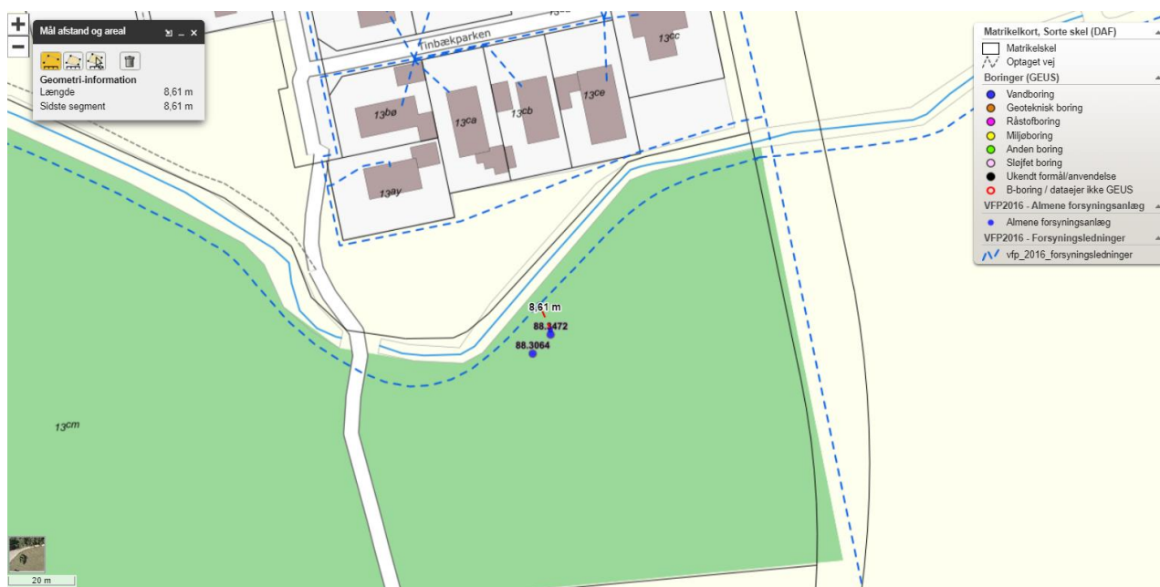
Figur 1: Udkast til placering af fremtidige råvandsledning.

Endvidere søges om at etablere en råvandsledning på ca. 10 m til den nye boring DGU nr.: 88. 3472. Råvandsledningen kan holdes indenfor kommunens matrikel (Skovby By, Skovby, matrikel 13cm), hvor der allerede foreligger en aftale med tilladelse til et forsyningsanlæg med tilhørende ledninger. Den forventede placering af råvandsledningerne er vist på Figur 1. For anlæg af vandledning over større afstande skal der udarbejdes en VVM-anmeldelse i henhold til §16 i LBK nr. 973 af 25/06/2020 (Miljøvurderingsloven). Det vurderes, at den ansøgte strækning på ca. 10 m råvandsledning ikke falder indenfor §16, og at der ikke skal udarbejdet en VVM- anmeldelse. Såfremt Skanderborg Kommune er uenig, udarbejder Skovby Vandværk straks en VVM-anmeldelse.